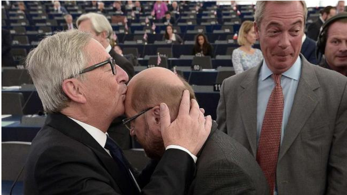
Bild: Junker stellt in Erinnerung an die sozialistischen Freundschaftsstaaten mal wieder den Affenzirkus, EU-Parlament, zur Schau.

Immer mehr Menschen finden das Leben in der EU, in der BRD unerträglich, ebenso die NATO-Mitgliedschaft. Sie fiebern beim Brexit mit, da sie sich erhoffen, es möge positive Auswirkungen auf die BRD haben. Sehr viele Menschen möchten eine positive Veränderung haben und schimpfen im Internet, wie die Rohrspatzen! Dabei wäre es viel besser nicht im Internet, sondern auf der Straße Flagge zu zeigen!